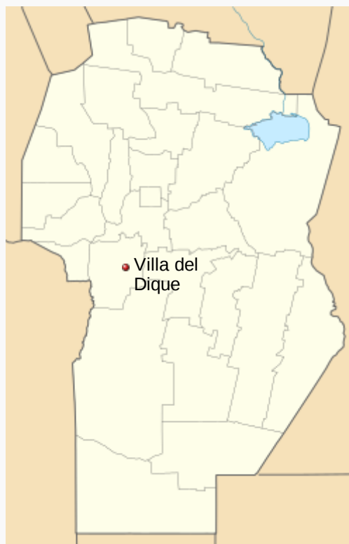
Localización de Villa del Dique en Provincia de Córdoba (Argentina)