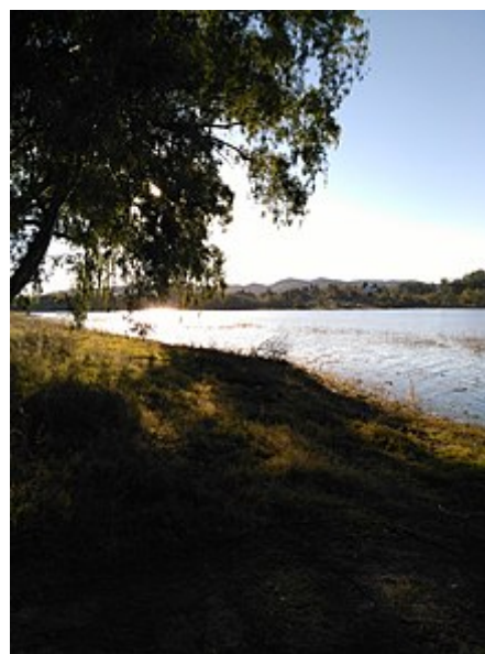
Vista de un sector de la costa del lago en Villa del Dique.